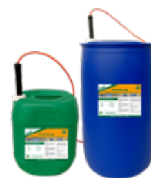
Entnahmeset für Kanister und Fass