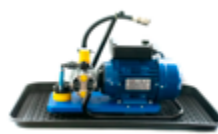
Pumpenblock mit Unterlegschale 240 V

Mehr Informationen finden Sie in unserem Prospekt „Teleskopstangensystem“