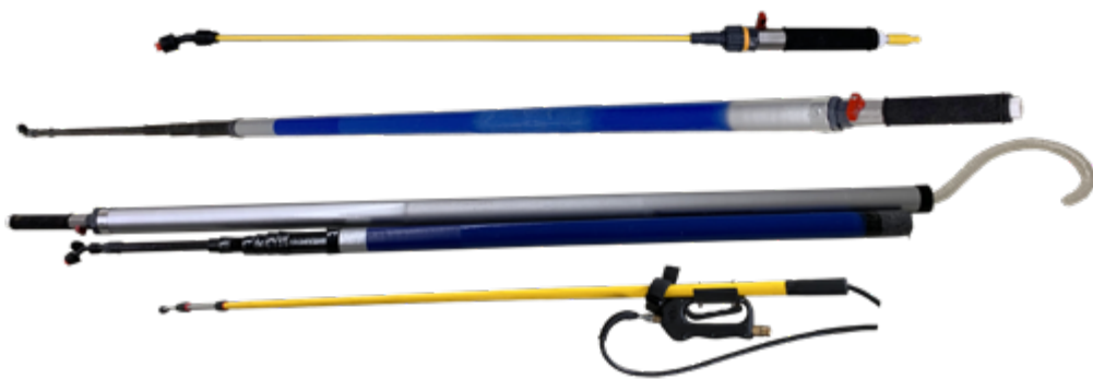
Teleskopstangensystem im Einsatz