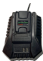
Akku 18 V für Akkusprüher mit Ladegerät