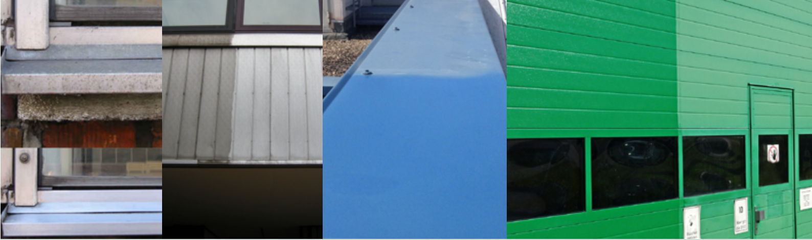
Alu Rein S