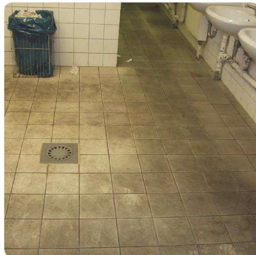
vor der Behandlung