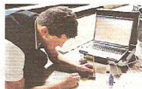
„Ich beginne klein am Stein, mit wenig Chemie und Mikroskop“, sagt Steiner